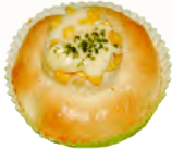
コーンマヨロール 120円