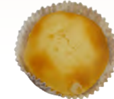
アーモンドドラムレーズンカップ 150円