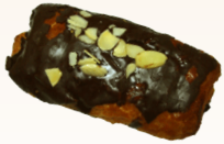
チョコディニッシュ 150円